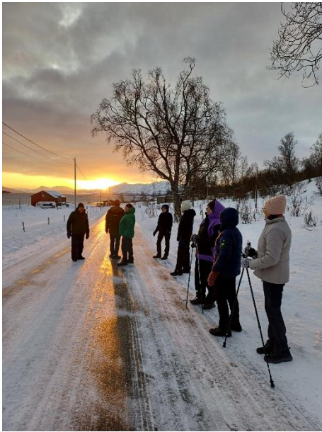
Tur til Håkøya og første soldag i januar.

Hver onsdag gjennom hele året møter turdeltagere utenfor Kvaløy kirke for gåturer på Kvaløya. De fleste turene er i nærområdet til kirka, men ofte er det utfart til Håkøya, Ersfjorden, Hella, Sommarøya, Henrikvika, Blåmannsvika etc. Hver uke møter 13-16 godt voksne kvinner og menn til gåturene.